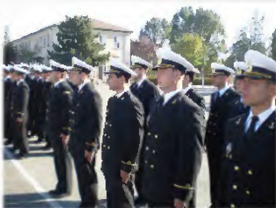
Festivitatea de deschidere a Cursului de Bază