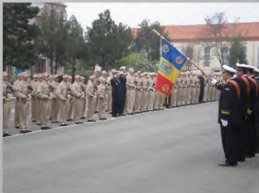
Depunerea Jurământului Militar 4 Iunie 2011

Modulul doi constituie ultima etapă în pregătirea noastră, și sfârșitul instrucției, începutul unui nou drum, care după experiențele dobândite îl privim mult mai încrezători în propriile forțe, în deciziile luate și în acțiunile întreprinse.