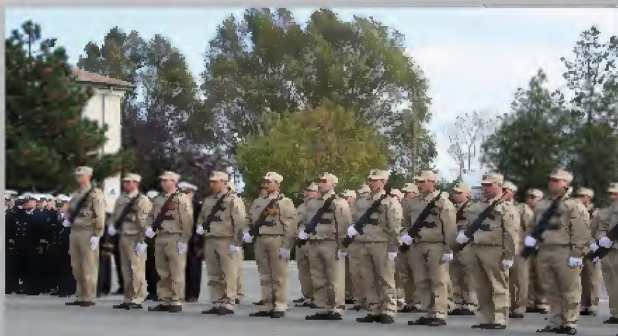
Depunerea Jurământului Militar 4 iunie 2011

certitudine debordantă că ne-a determinat să privesc lucrurile printr-o altă prismă, aceea că toți avem niște reguli de respectat și că ceea ce facem are urmări și consecințe, benefice nouă, atât timp cât nu uităm pentru ce ne-am înscris aici și care este motivul principal, de a urma o carieră militară.