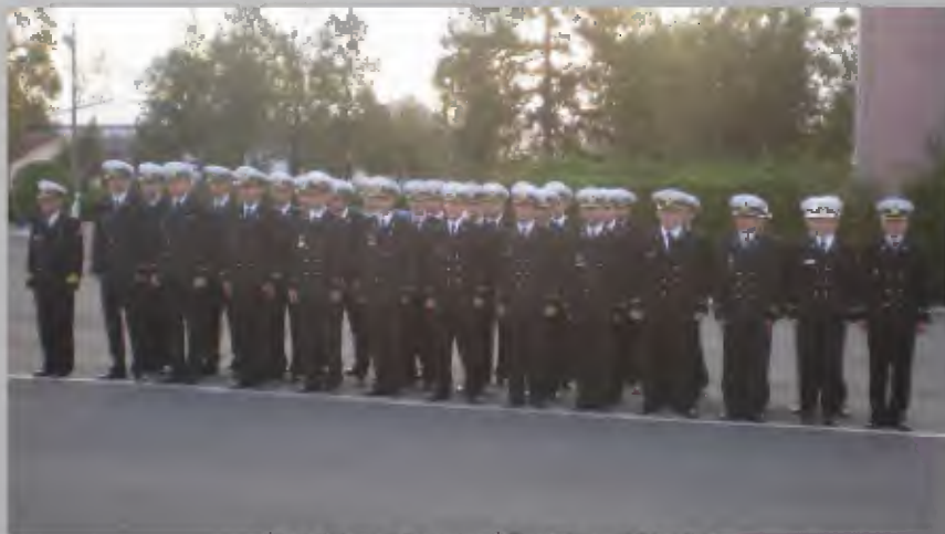
Cursul de bază pentru Ofițeri - promoția a II-a

În rest, doar cei care nu au fost Aspiranți nu înțeleg sentimentele inițiale. Pentru toți ceilalți lupi sau, actualmente, pul de lup de mare, imaginea de ansamblu e general valabilă.