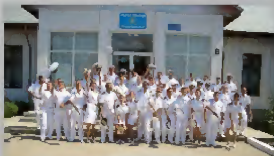
Festivitatea de absolvire a Academiei Navale

Diverse motive ne-au îndrumat pașii în sistem. Unele financiare, altele teribiliste. Iesim din academie cu ele deformat , mai mature și mai puțin materiale .Avem o imagine mai exactă asupra celor ce ne așteaptă la început de carieră militară , mai clară față de cea a adolescentului care a intrat odată în academie ,mai puțin vizionară , mai modestă . Mulți ne-am imaginat viața de ofițer de marină petrecută pe unduire de valuri, nu la cheu și cu un volum mai mic de documente , doctrine și registre . Va trebui să găsim alte motivații interioare